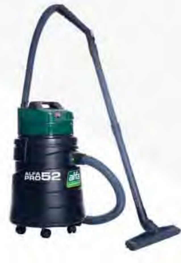
Alfa Pro 52