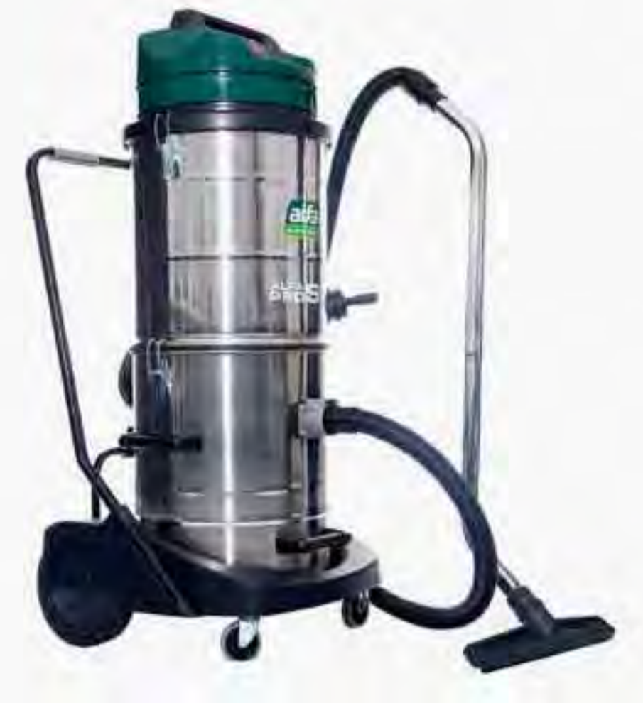
Alfa Pro SF