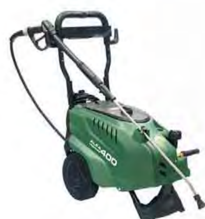
Alfa Pressure 400