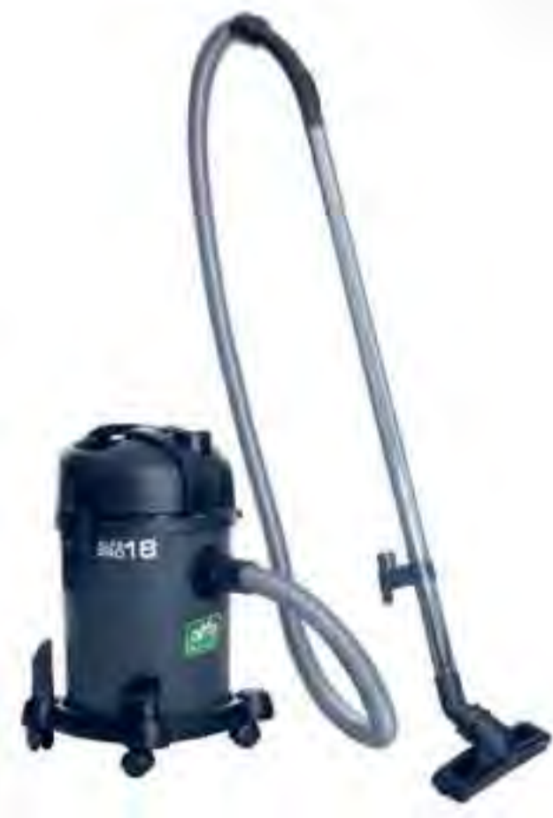
Alfa Pro 18