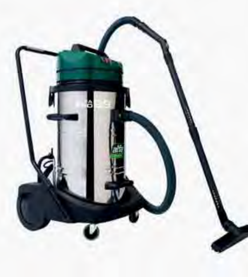
Alfa Pro 89