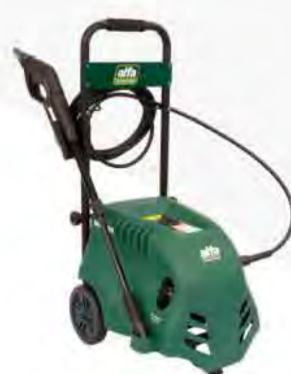
Alfa Pressure 100