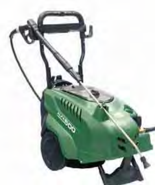
Alfa Pressure 500