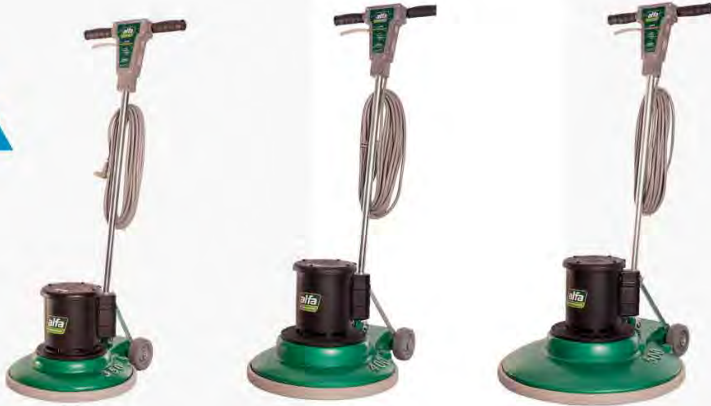
Alfa 350 BNDES