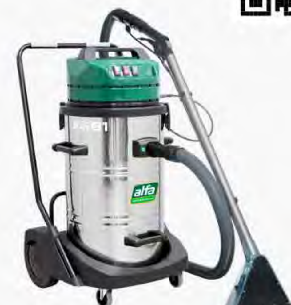
Alfa Ext 81