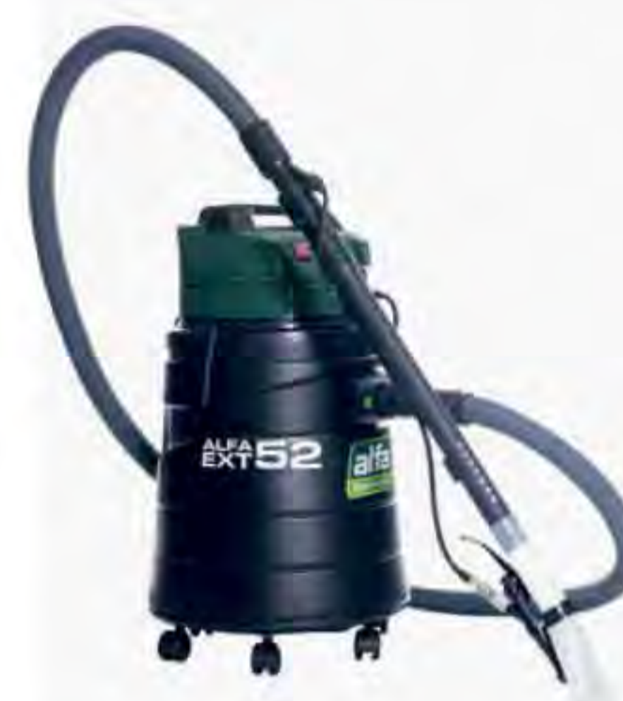
Alfa Ext 52