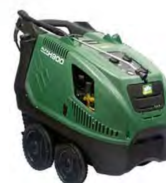
Alfa Pressure H900