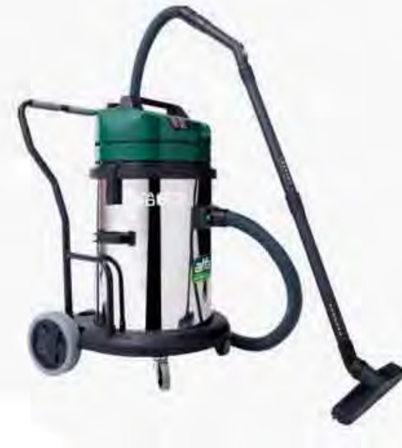
Alfa Pro 62